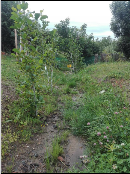
Abb. 2: Nach der Maßnahme: Wiederhergestellter Abschnitt des Borsberger Dorfbaches, 15.08.2019

Länge von ca. 100m neu gestaltet und mit standortgerechten Gehölzen bepflanzt (Schwarzerle, Gemeiner Schneeball etc).