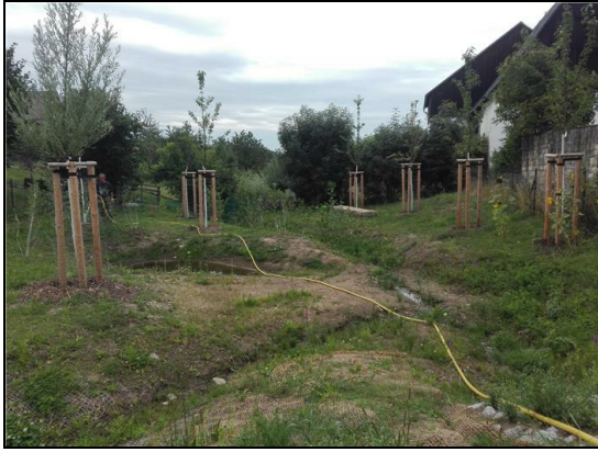
Abb. 4: Nach der Maßnahme: Wiederhergestellter Abschnitt des Borsberger Dorfbaches mit Baumbepflanzung im Gewässerrandstreifen, Blick stromab, 15.08.2019