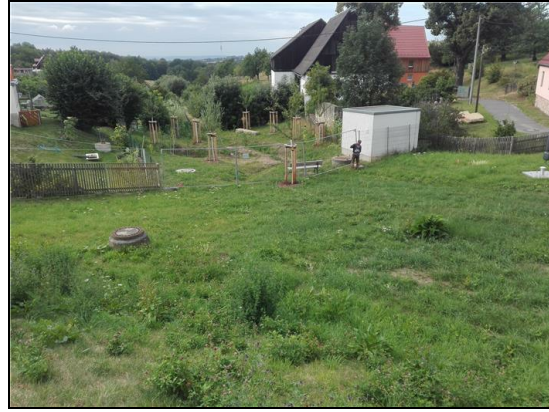
Abb. 5: Nach der Maßnahme: Blick stromab auf wiederhergestellten Abschnitt des Borsberger Dorfbaches im Bereich des ehemaligen Feuerlöschteiches, 15.08.2019