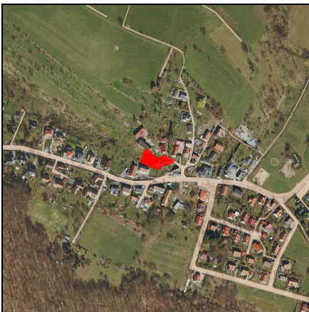
Lageplan Maßnahme, Maßstab 1:10.000