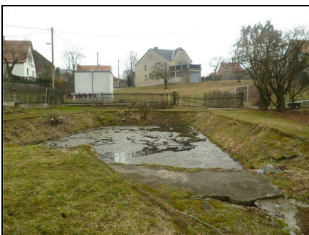
Abb. 1: Vor der Maßnahme: ausgebauter Borsberger Feuerwehrteich im Quellbereich des Borsberger Dorfbachs, 15.03.2011